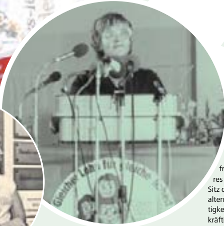
Roten Burg, dem Schulungs- und Erholungsheim der IG Druck und Papier in Springen/Taunus.

Dort verbindet die leidenschaftliche Gewerkschafterin juristische mit politischen Fragen. Eines Tages kommt der Anruf der Zentrale aus Stuttgart: »Wir wollen dich bitten, für den Hauptvorstand zu kandidieren.« »Für was denn? Frauensekretärin? So ein Quatsch, so was mache ich nicht.« »Überleg doch noch.« »Nein, ich will das nicht.«