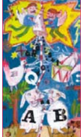
Illustration: Thomas Klefisch