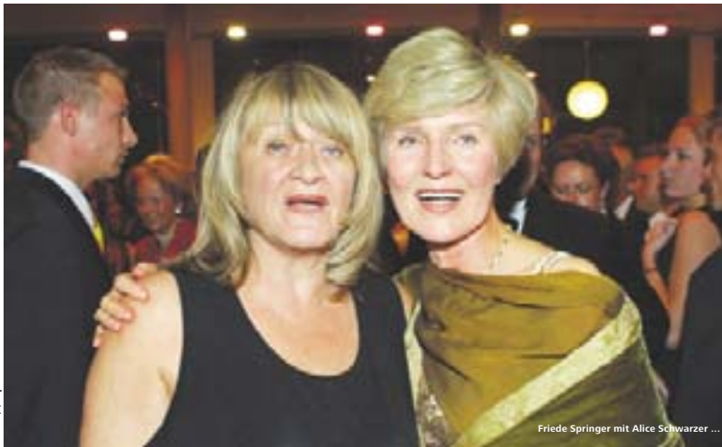
Friede Springer mit Alice Schwarzer ...

Dem Klischee entsprechend verbirgt die goldene Fassade natürlich, dass dahinter nicht nur Glamour und